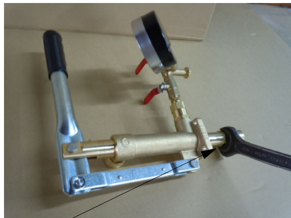
22mmのスパナーで吸水ケースを取り外す