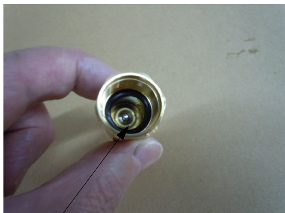
吸水ケース内のOリングと弁球